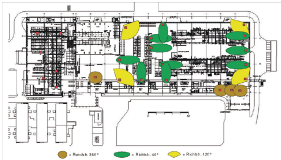
Bild 3. Die Funkübertragung für das fahrerlose Transportsystem: Das WLAN ist in dezidierte Access Domains (separate SSIDs für FTS-WLAN und ein weiteres WLAN-Netz) aufgeteilt.

ting-Interfaces mit der gleichen IP-Adresse führen unweigerlich zu Netzstörungen.